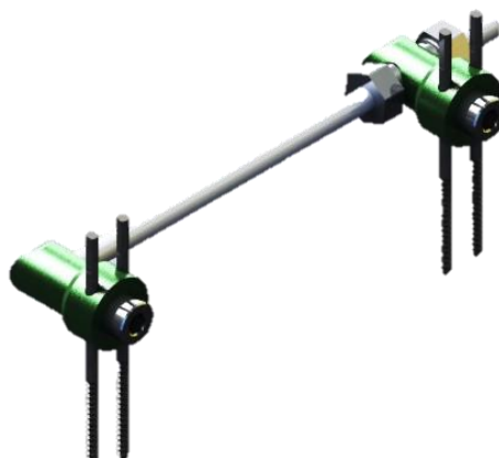
Fixador Dinâmico para Extremidades GD MINIFIX DINÂMICO MÉDIO STEM